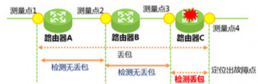
图 1 TWAMP 测量方法

TWAMP 可基于五元组进行测量，强大的逐点性能统计和故障定位功能。当发现测量点 1 和测量点 4 之间发生丢包时，逐跳测量，发现测量点 1 和测量点 2 之间无丢包，测量点 2 和测量点 3 之间无丢包，因此可以判断丢包发生在测量点 3 和测量点 4 之间。如图 1。