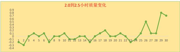
图 1 全水分检查性干燥质量变化趋势图（2.0–2.5 小时）