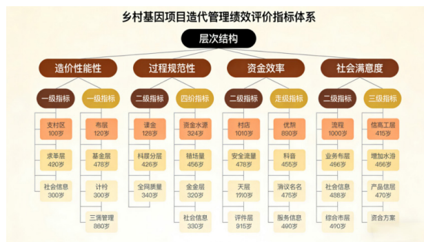
图2 乡村基建项目造价管理绩效评价指标体系图

二是完善全过程监管与绩效评价机制。构建“事前预防、事中控制、事后考核”的全过程监管体系，事前加强对项目概预算的审核力度，确保预算编制的合理性与合规性；事中建立常态化的监督检查机制，定期对项目的工程量签证、材料价格调整等关键环节进行核查，及时发现并纠正造价管控中的问题；事后强化竣工结算审计，严格审核项目的实际造价与预算的偏差情况，确保财政资金的合理使用。同时，建立科学的绩效评价体系，将造价控制效果、资金使用效率、项目运营效益等指标纳入评价体系，对项目实施效果进行全面考核，并将考核结果与相关主体的信用评级挂钩。此外，健全责任追究机制，对于在造价管理中存在失职渎职、虚报冒领等行为的主体，依法依规追究其责任，形成强有力的监管震慑。