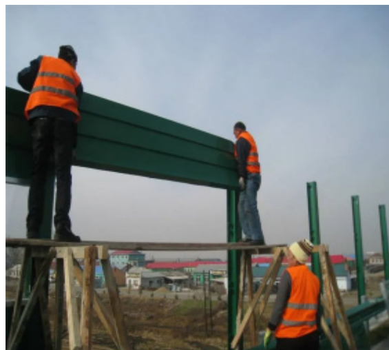
图3 铁路施工现场安装防护屏障与安全围挡施工图

新型材料与结构的创新应用，提升了铁路施工现场的安全防护效果。例如，防护屏障与安全围挡的创新设计不仅增强了物理防护性能，还采用了轻便、耐用的材料，便于快速安装与拆卸，适应复杂的施工环境。这些材料能够有效隔离施工区域与外部环境，防止人员误入危险区。高强度防护材料的研发则针对施工现场可能遇到的强烈冲击力、火灾等风险，开发出具有更高抗压、抗火等性能的材料，进一步提高了施工安全性。