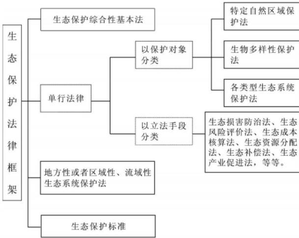
图2 生态保护法律框架