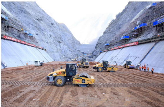
水利水电工程施工现场

水库蓄水后,原有的河道水文条件发生改变,水流速度减缓,泥沙沉积增加,可能导致水质下降,甚至出现富营养化问题。原本适应自然水流节律的水生生物面临生存挑战,一些依赖流速和水温变化的鱼类可能无法正常繁殖,导致种群数量下降。此外,水位上升可能淹没大片陆地,导致森林、草地甚至农田消失,生态系统结构发生变化 [2] 。湿地生态系统对水位变化尤为敏感,一旦水位波动过大,原本的湿地植被可能无法适应新的水文条件,导致湿地生态功能退化。另一方面,水库运行过程中需要定期调节水位,水位频繁变动可能导致岸边土壤侵蚀加剧,引发滑坡、塌方等地质灾害,进一步影响当地生态环境。