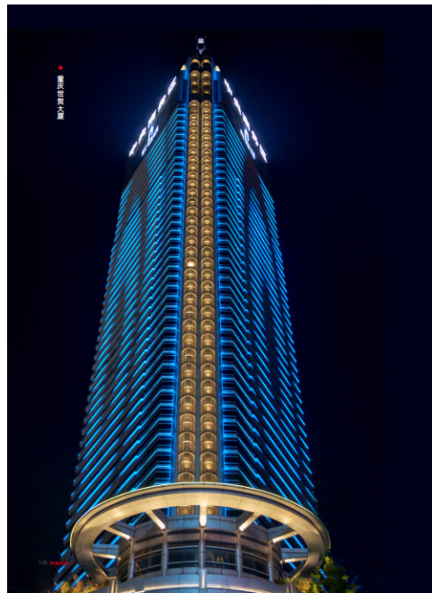
图2 案例建筑立面亮化工程应用现场图

复杂建筑立面亮化工程属于核心应用场景（见图2），可应用于L型、U型、多立面的写字楼、酒店、历史建筑等项目。例如，建筑的东、西两侧或是南、北立面所安装的灯具可利用“一拖二”放大器分别予以驱动，达成就近布线与分区调控，防止因绕线引发的信号衰减，并且利于依据不同立面的亮化主旨与展示要求，灵活变动控制参数，营造出既具差异化又协调统一的灯光效果。