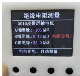
图 3 绝缘电阻测量仪自动测量模式界面

绝缘电阻测量仪在检测电机断电后，自动进入测量模式，完成 A、B、C 三相绕组对地绝缘电阻的实时采集与状态判别。根据《三相异步电机维护与检修》(GB/T 30555-2014)，结合工业现场运维经验，设定 0.5MΩ 为下限报警阈值，当某一相绝缘电阻低于阈值时，立即输出报警信号，见图 3。