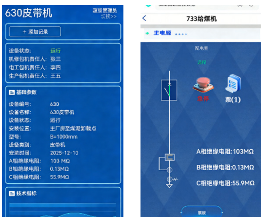
图 4 移动式终端显示界面

移动式终端可同步接收测量数据，界面可清晰显示各相绝缘电阻值及设备状态，系统数据传输稳定性良好、终端显示实时性高，见图 4。