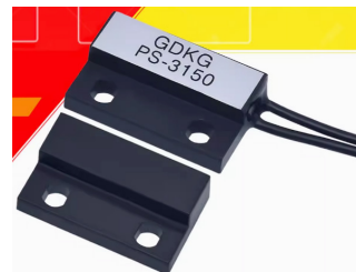
图 1 磁控开盖

该类磁控开关只能接低功率负载（通常应用在门柜上控制灯具），所以需要与交流接触器组合形成前置控制电路进行使用。