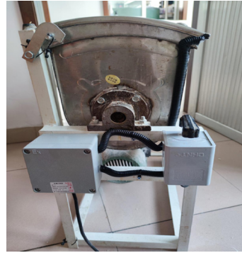
图 4 安装测试好后的正常使用状态 (侧面) (设置开盖联锁保护装置)

(3) 该开盖联锁安全保护装置的设计应用, 填补了社会市场和面机类设备联锁保护装置缺失的空白, 鉴于其能够实现该类设备“本质安全”的安全科技属性和防水、防尘、高寿命、低成本且易于实现消费市场量产的特点, 能够带来良好的社会效益。