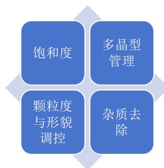
图 2: 药物合成结晶技术控制要点

量、保障最终晶体品质则成为了十分关键的问题。在结晶的过程中介稳区是十分重要的区域，在该区域内溶液虽然已经达到饱和状态但却不会自发成核。在技术控制期间可通过控温或反溶剂滴加等多种方式使体系的过饱和度维持在该区间，为晶体生长提供较好的环境。但是若控制不当则会导致过饱和度瞬间飙升，越过介稳区上限进而产生大量细小且不规则的晶体，难以过滤洗涤，还很有可能会包裹母液和杂质影响产品质量 [1] 。