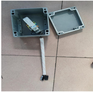
图 3 前置控制电路组合、配套铝质防爆盒

前置控制电器组合连接好之后, 可先用普通灯泡加照明开关进行测试, 磁控开关能够在 220V 电压下与交流接触器配合使用, 控制效果良好, 测试结果与设计思路一致。