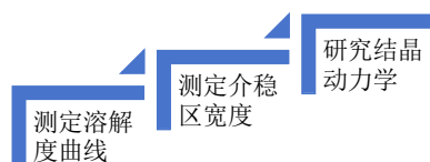
图 1: 药物合成结晶过程

可更好地保障药物合成结晶的速率和稳定性。悬浮密度是指在同等单位体积的溶液中能够析出的药物结晶体质量，悬浮密度对于药物合成结晶的速率影响是相对较大的，可通过悬浮密度测试对药物合成结晶技术参数作出调整，确保药物合成结晶处于最佳状态。过饱和度主要分析的是药物合成晶体在结晶时的溶液体系，分析结晶所用溶液，可采用粒度分析仪进行检测，明确结晶体的粒度大小及结晶时的分布状态。