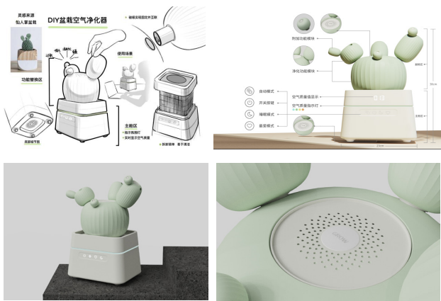
图 3.1 方案设计

基于设计定位，本文的灵感来源于仙人球（如图 3.1 所示），创造性突破了传统空气净化器的形式。整机主要分为主舱区与模块替换区两个部分，用户可以根据自身需求，自由组合替换副舱区的模块，具有强烈的装饰性与趣味性。净化器的主舱区具有控制净化器、显示空气质量值、空气质量指示灯、大颗粒初筛等功能。副舱区由各个可替换功能模块组成，造型多变，用户参与度高，体验感佳。功能模块除净化空气等主要功能外，还可搭配香薰功能模块和纯装饰模块。副舱区的可替换功能模块分为大中小三个型号，并且设计了三个不同口径的对接口进行连接。大号与中号功能主要为空气净化与消毒，小号则是附加香薰功能。同时，考虑到用户购买本产品因价格因素及个人需求而未购买全套以及在模块使用较少时产品的美观性，特增加不具有功能的装饰模块。